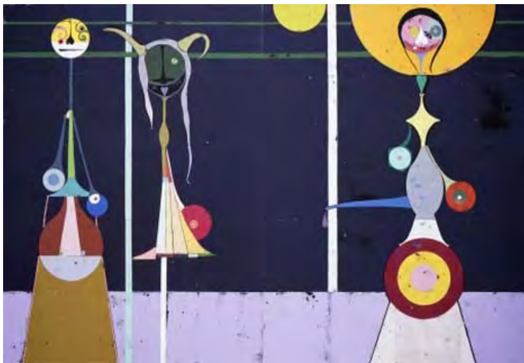
Uwe & Gert Tobias: Ohne Titel, farbiger Holzschnitt auf Papier, 268 x 401,7 cm