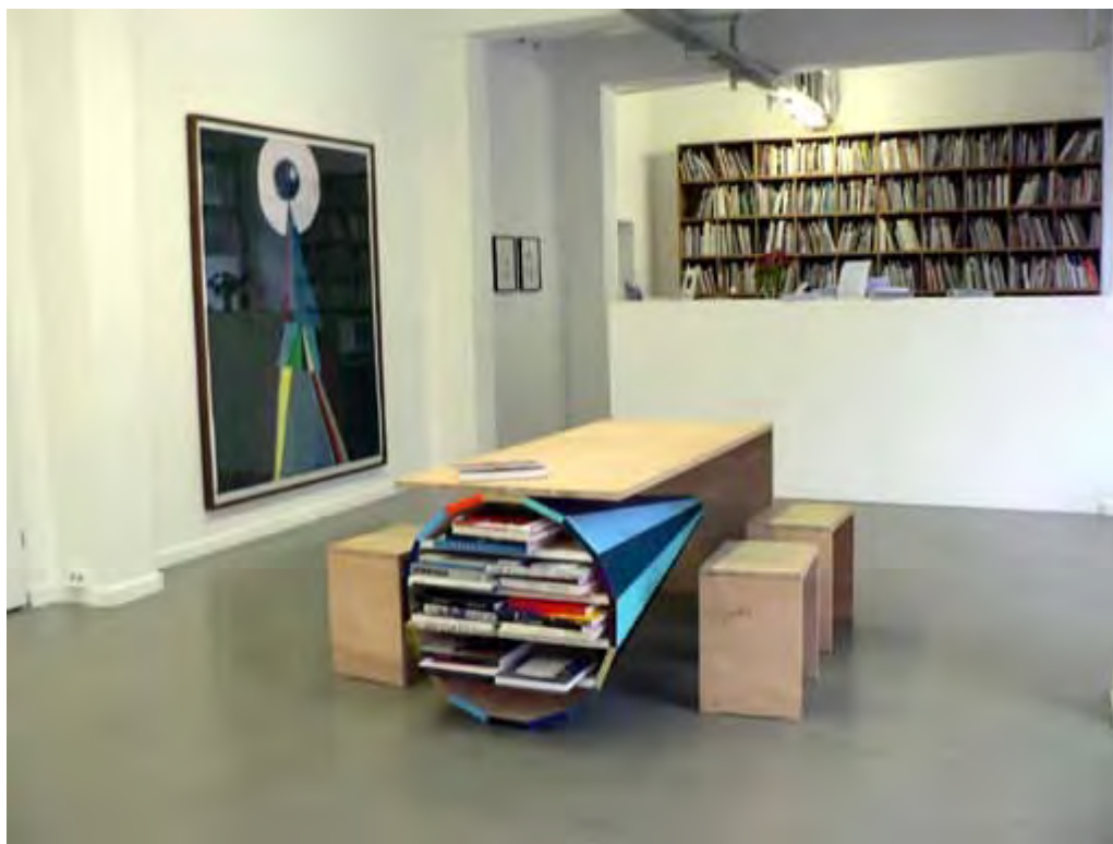
Uwe & Gert Tobias: Ohne Titel (v.l.), farbiger Holzschnitt auf Papier, 2006, 200 x 170 cm In der Mitte: Ohne Titel, 2007, Holz bemalt, 80 x 80 x 180 cm, Ed. 1/3. Deutscher Künstlerbund Berlin