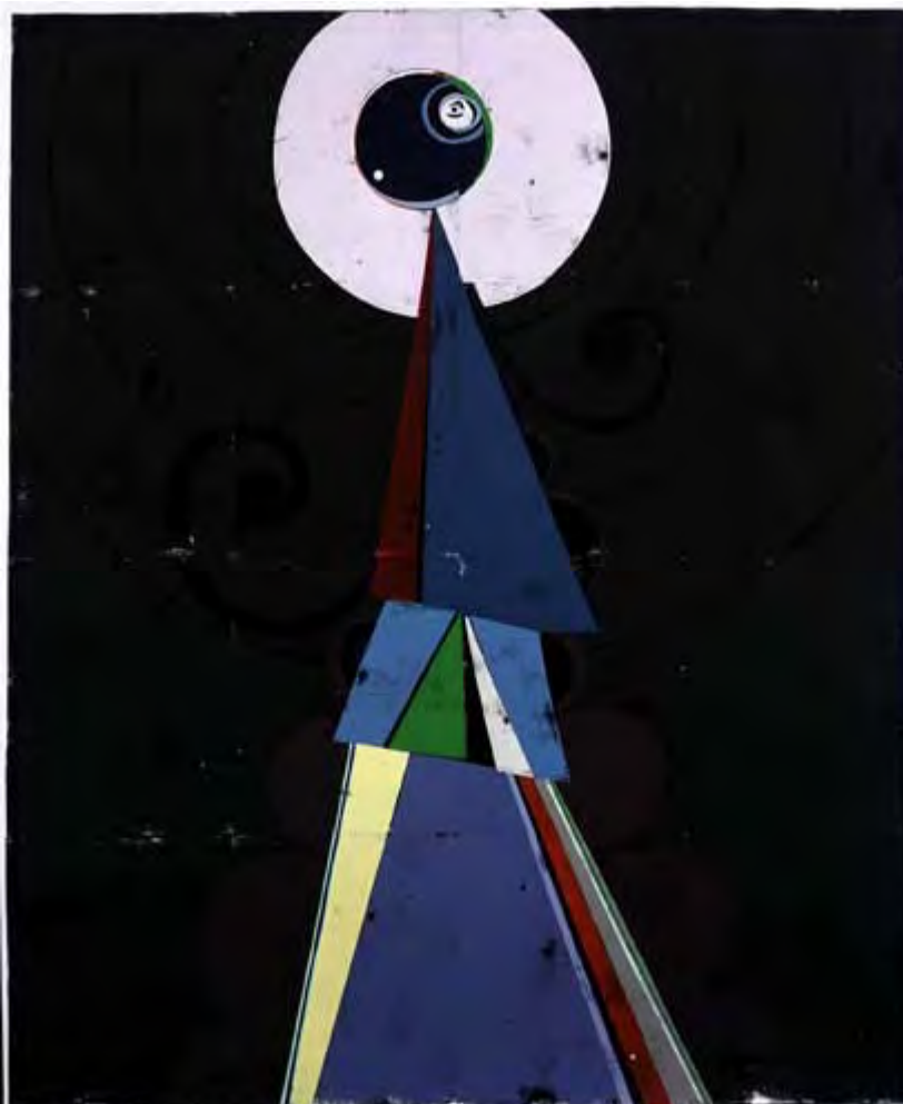
Uwe & Gert Tobias: Ohne Titel, farbiger Holzschnitt auf Papier, 2006, 200 x 170 cm

"Dracula" (1897) und dessen zahlreiche Verfilmungen im Westen besser als Transsilvanien bekannt, mit den Klischees vom blutsaugenden Adligen auseinander. Die Beschäftigung mit dem bekanntesten transsilvanischen Vampir aus der Feder eines irischen Schriftstellers, der nie in Transsilvanien war, brachte den Zwillingen sogar die zweifelhafte Bezeichnung "Draculas Drucker": Ruhm kann manchmal auch etwas bitter schmecken. Dabei weist bereits der Titel ihrer ersten Einzelausstellung "Come and see before the tourists will do. The mystery of Transylvania" in der sie vertretenden Kölner Galerie Michael Janssen (2004) darauf hin, dass sie sich über den im Westen weitverbreiteten Mythos mokieren, an dem Rumänien seit den 1970er Jahren weiterstrickt, um Touristen ins Land zu locken.